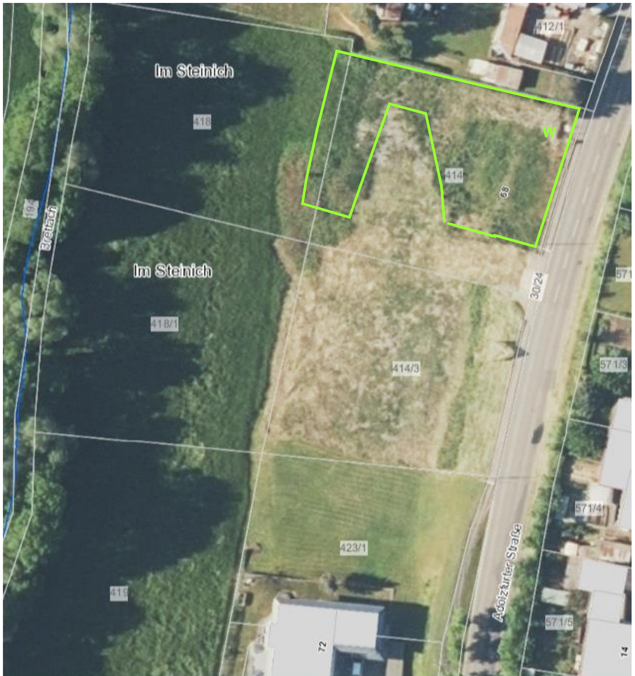
Lageplan 1: Habitat der Zauneidechse (grün) und Nachweis (W = Weibchen)