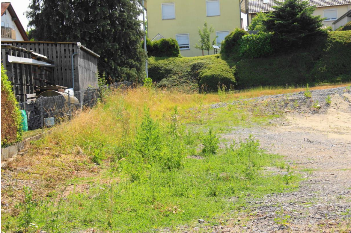
Foto 5: Habitat der Zauneidechse außerhalb des Plangebiets im Norden von Flst. 414