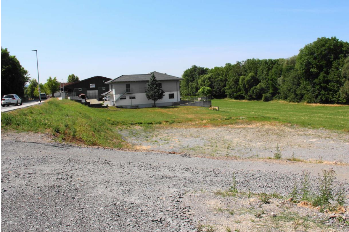
Foto 1: Blick in das Plangebiet von Nordosten; Flst. 414/3 im Vordergrund