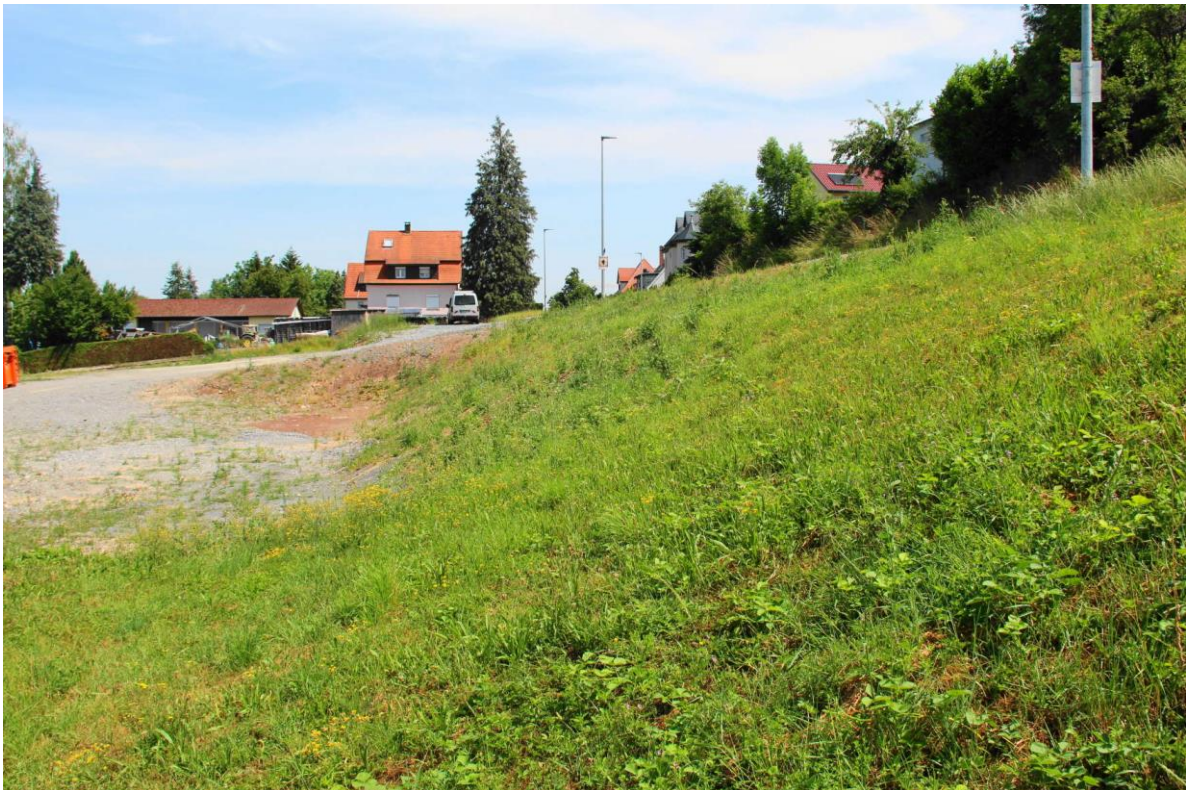
Foto 4: Böschung an der Ostgrenze von Flst. 414/3 mit nur geringem Habitatpotenzial für die Zauneidechse