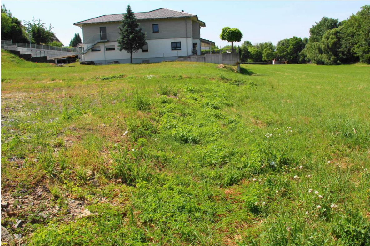
Foto 3: Reste eines potenziellen Habitats an der Westgrenze von Flst. 414/3